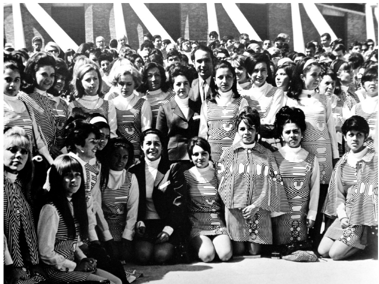
Un grupo de edecanes vestido en minifalda con el diseño oficial de la Olimpiada.

El Estado, obviamente enamorado con este emblema visual de un México ultra-moderno, lo reproducía por todos lados. Cooptada, la estética sicodélica—de un "Op Art"—se transformó en un discurso oficial; perdió cualquier matiz contracultural en el proceso de ser domesticada, disciplinada. Un edecán con minifalda diseñada del logo oficial, no podría ser amenaza contra-cultural.