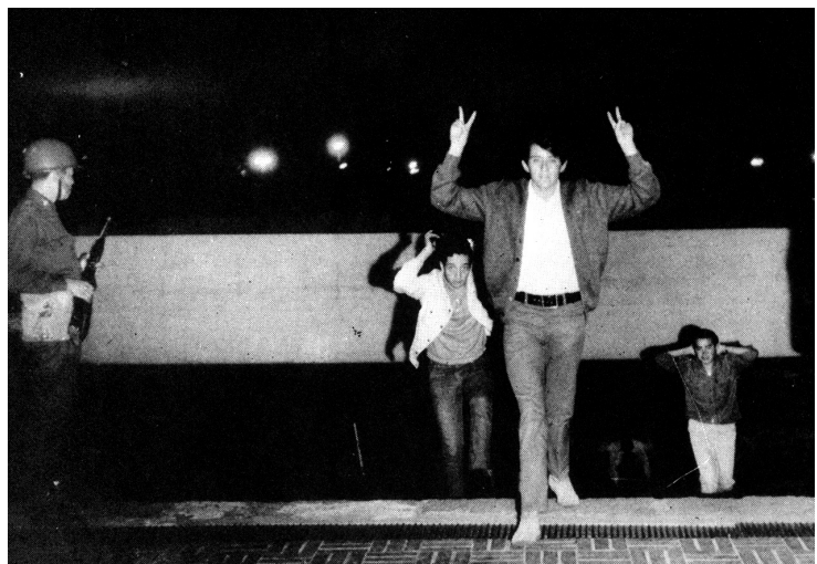
Estudiantes mostrando la 'V' después de la invasión a la Universidad Nacional Autónoma de México (UNAM), septiembre 1968.