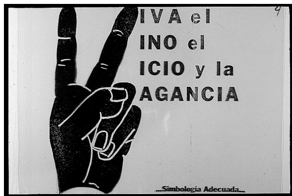
Folleto sin atribución distribuido durante el movimiento estudiantil de 1968 en México.

contracultura subversiva, cuyos valores amenazaban al mundo entero: "La 'V' es también el saludo de los hippies," seguía un folleto distribuido del Frente Renovador, "esos alegres vagabundos drogadictos enemigos del baño, que han hecho de la irresponsabilidad una filosofía, y cuya victoria máxima sería lograr una reforma agraria mundial para que todos los países se dedicaran exclusivamente a la siembra de marihuana y amapola." (Ibid.). Quiere decir, para muchos adultos—y me atrevo a sugerirlo, para muchos estudiantes los cuales decidieron no participar en el movimiento del '68—la "V" era señal del desmadre. El año olímpico, cuando los ojos del mundo miraban hacia México para ver si realmente el país había avanzado suficientemente o si todavía era lugar de bandidos y atraso social, esos jóvenes rebeldes, esos rebeldes sin causa estaban sueltos. "Viva el vino, el vicio y la vagancia, simbología adecuada." Este documento (vea la Imagen 2), demuestra no solamente la estrategia de la derecha para contrarrestar al movimiento estudiantil, pero más importante nos revela los temores y ansiedades de una gran parte de la población, la cual veía a los manifestantes con cinismo y rechazo.